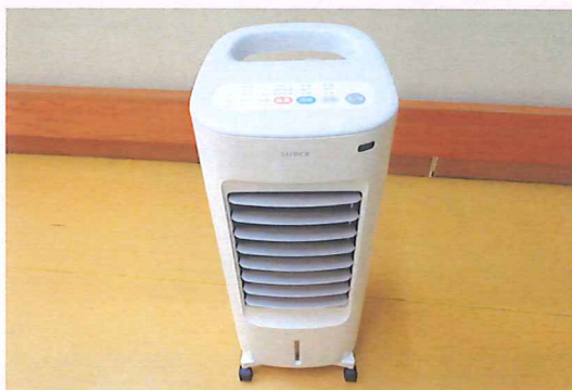
冷風機 購入しました