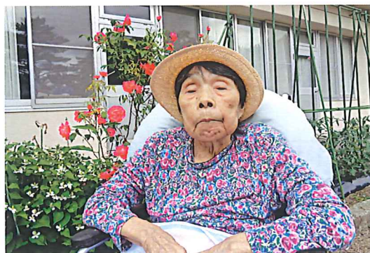
今年も綺麗な お花が たくさんです。