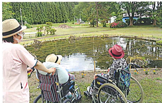
気分爽快に なりました！！