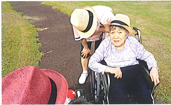
外 気 浴