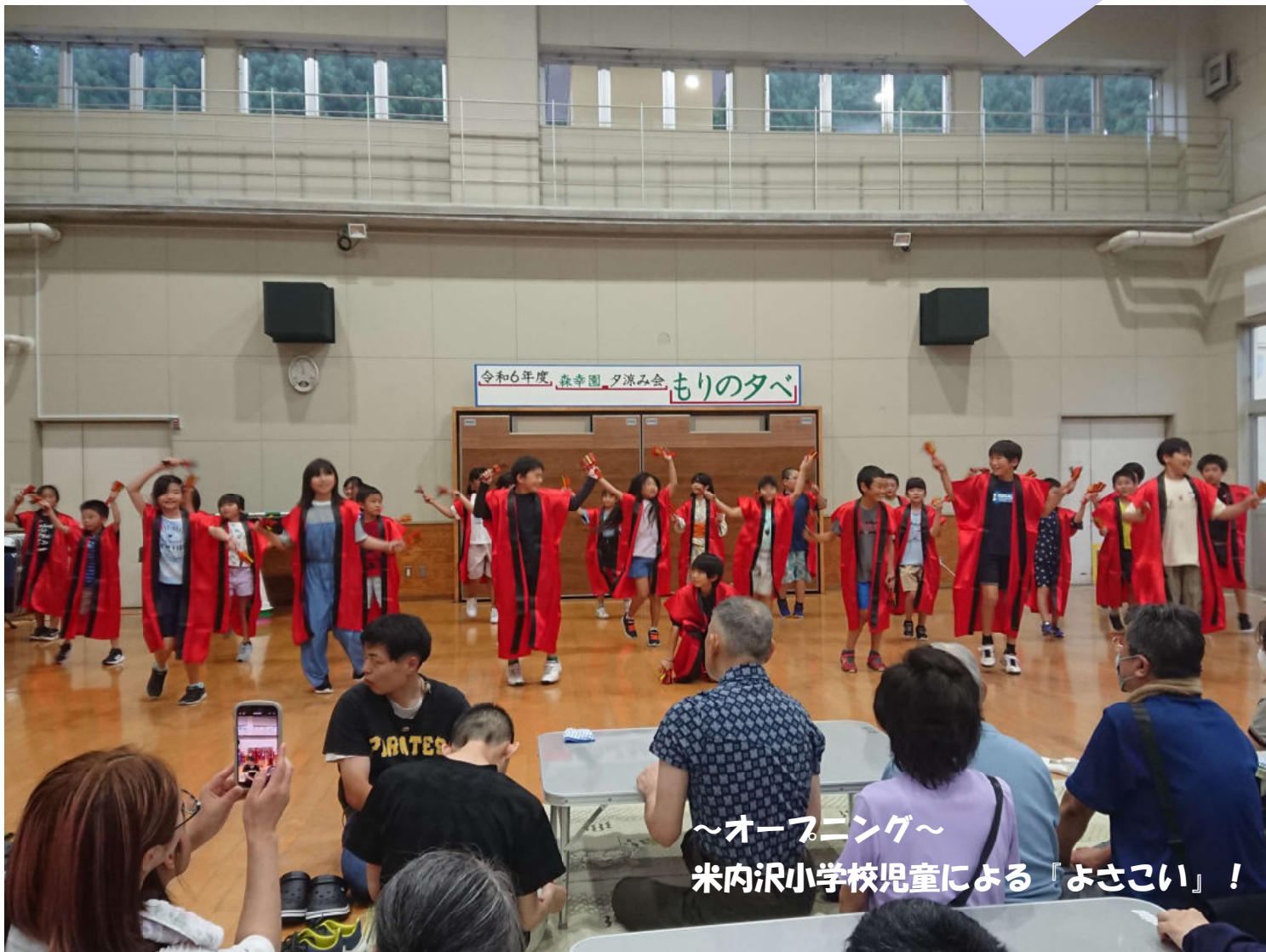
~オープニング~ 米内沢小学校児童による「よさこい」!