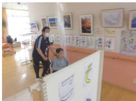
安全を確認して利用者を避難

6月28日、もりの郷にて北秋田市消防署員立会のもと、総合避難訓練を行いました。訓練は、ボイラー室からの出火を想定し、火事ぶれから消防への通報、初期消火、利用者の避難場所までの誘導を行い、避難訓練後には、消防署員の指導の下、消火器を使用した消火訓練も行ないました。訓練に参加した利用者の皆さんは職員の指示に従い、落ち着いて避難場所まで移動していました。