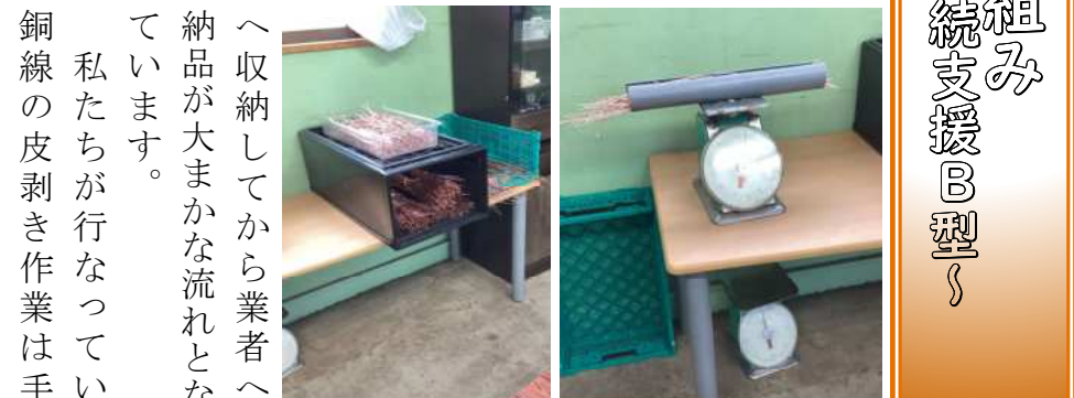
計量した銅線を束ねた様子

へ収納してから業者への納品が大まかな流れとなっています。 私たちが行なっている銅線の皮剥き作業は手間はかかりませんが、リサイクル（SDGs）、環境改善にも繋がっており、とても素晴らしい仕事をしていると誇りを持って取り組んでいます。また、利用者の皆さんの工賃向上計画の一環としても取り組んでおり、今後とも社