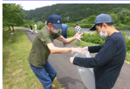
清掃活動に取り組む利用者

6月18日、天候に恵まれ、利用者14名、付添職員5名の総勢19名で五味堀地区に隣接している阿仁川河川敷とそこに付帯している桜堤公園で清掃活動を行いました。 参加した利用者は、互いにコミュニケーションを図りながら散乱しているゴミを拾い、「ここにもあった」「あそこにも落ちてる」などと、拾ったゴミを回収袋に集め、綺麗になった場所を見て満足していました。