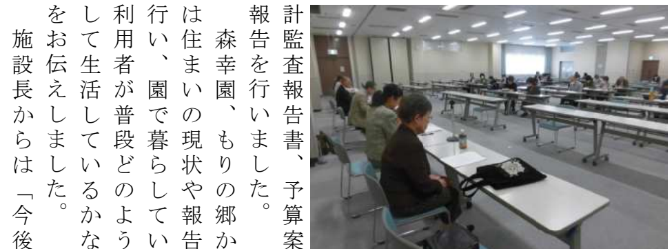
27家族が出席した総会の様子

施設長の挨拶 コロナのキット検査もなく園の行事にも以前と同じように園に足を運んでいたただけが幸いです。話しが、今後はコロナ前と同じように家族と利用者がふれあえるようになりました。