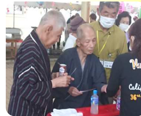
笑顔があふれる・・・