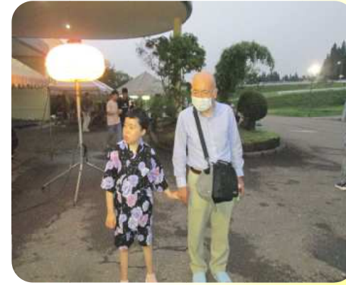
ひと時の大切な時間・・・