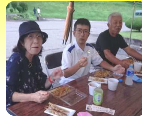
心が触れ合い・・・