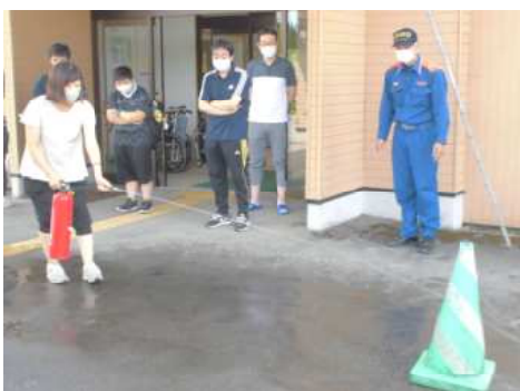
水消火器で訓練する職員

6月28日、もりの郷にて北秋田市消防署員立会のもと、総合避難訓練を行いました。訓練は、ボイラー室からの出火を想定し、火事ぶれから消防への通報、初期消火、利用者の避難場所までの誘導を行い、避難訓練後には、消防署員の指導の下、消火器を使用した消火訓練も行ないました。訓練に参加した利用者の皆さんは職員の指示に従い、落ち着いて避難場所まで移動していました。